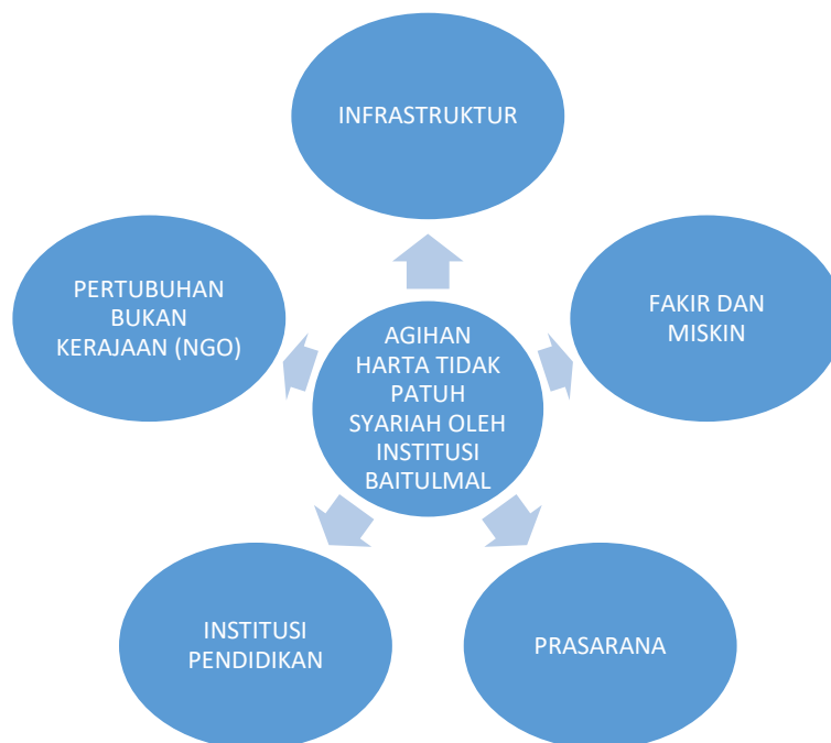
Rajah 2: Kaedah Agihan Harta Tidak Patuh Syariah oleh Institusi Baitulmal

Berdasarkan Rajah 1 di atas, masyarakat khususnya umat Islam yang ingin mensucikan harta tidak patuh Syariah wajib menyalurkan harta tersebut kepada Institusi Baitulmal untuk diuruskan mengikut prinsip Syariah. Harta tidak patuh syariah tersebut merupakan wang haram yang tidak boleh digunakan oleh umat Islam ke atas dirinya dan ke atas orang lain tanpa melalui Institusi Baitulmal. Setelah harta tidak patuh syariah tersebut diterima oleh Institusi Baitulmal, harta atau wang tersebut akan bertukar menjadi suci dan halal untuk diguna, dibelanja atau diagihkan kepada pemohon oleh Institusi Baitulmal selagi mana ianya untuk masalah ammah sama ada merangkumi masalah yang diperakui oleh syarak atau masalah mursalah . Oleh itu, kajian mencadangkan beberapa cara pengagihan yang boleh dipraktikkan oleh Institusi Baitulmal mengikut pandangan alim ulama. Antara seperti Rajah 2 dibawah: