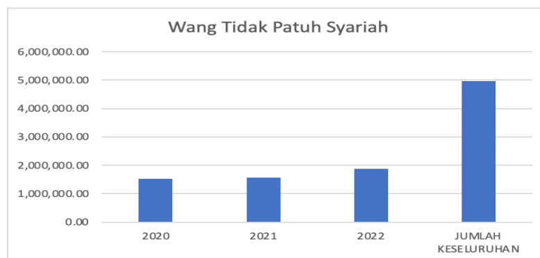
Rajah 1: Graf Peningkatan Hasil Penerimaan Wang Tidak Patuh Syariah, MAIS Tahun 2020-2022

Rajah 1 menunjukkan graf peningkatan hasil yang diterima oleh Institusi Baitulmal MAIS berkenaan wang tidak patuh syariah bermula 2020 sehingga 2022. Hal ini membuktikan bahawa Baitulmal MAIS sangat komited dalam menitikberatkan berkenaan pengurusan harta tidak patuh syariah ini. Selain itu, Majlis Agama Islam Kedah (MAIK) sering mengemaskini dan memaparkan di Portal Rasmi berkenaan Kutipan Semasa Hasil Baitulmal yang terdiri daripada hasil fidyah, infak fisabilillah dan wang tidak patuh syariah. Sehingga 05 November 2023 jumlah wang tidak patuh syariah yang diterima oleh Institusi Baitulmal MAIK ialah sebanyak RM 1382,786.89 (Portal Rasmi MAIK, 2023). Walau bagaimanapun, masih terdapat sesetengah Negeri yang masih tidak menekankan akan hal ini contohnya apabila paparan di laman web rasmi Majlis Agama Islam Negeri masih tidak menyatakan berkenaan harta tidak patuh Syariah. Hanya sesetengah Negeri yang ke hadapan dalam menguruskan harta ini sehingga terdapat negeri yang menyediakan kaedah penyucian melalui sistem Financial Process Exchange (FPX) . Maka kajian ini ingin mengkaji konsep kaedah Tasarruf Al-Imam 'Ala Al-Ra'iyah Manutun Bi Al-Maslahah dengan Pengurusan Institusi Baitulmal dalam menguruskan harta tidak patuh Syariah. Adakah kaedah fiqh ini dijadikan panduan dalam