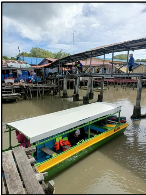
Foto 3: Bot adalah Jenis Pengangkutan yang Digunakan Penduduk untuk ke Pekan Beluran