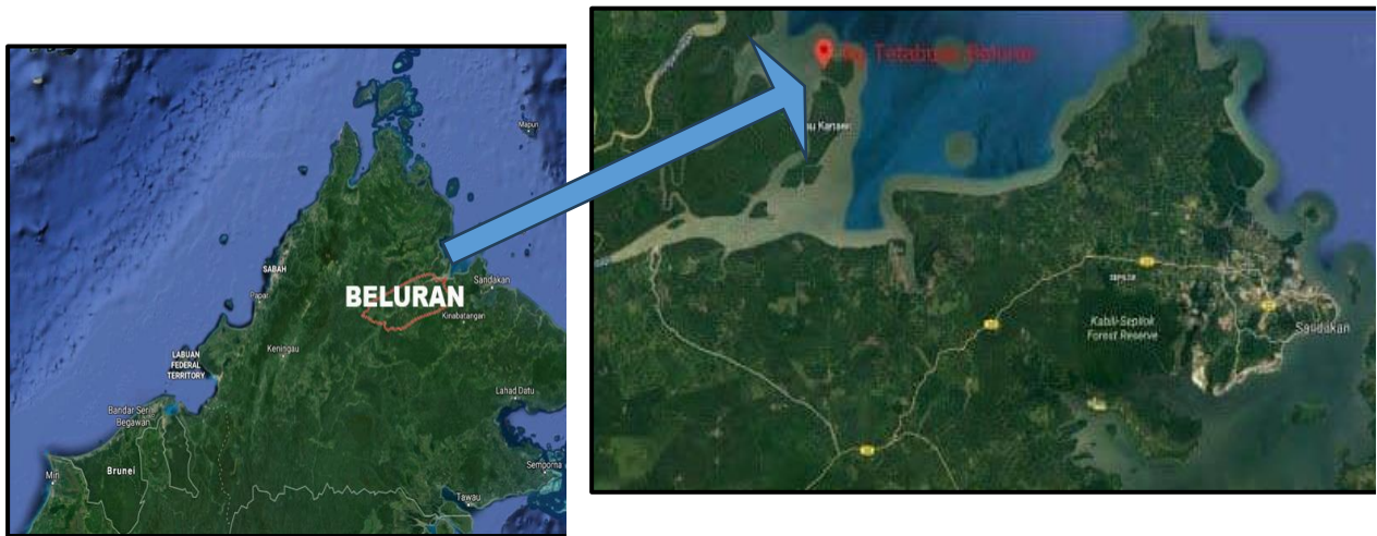
Peta 1: Kampung Tetabuhan dalam Peta Daerah Beluran