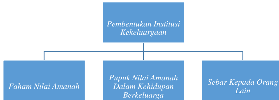
Rajah 2: Proses Penerapan Nilai Amanah