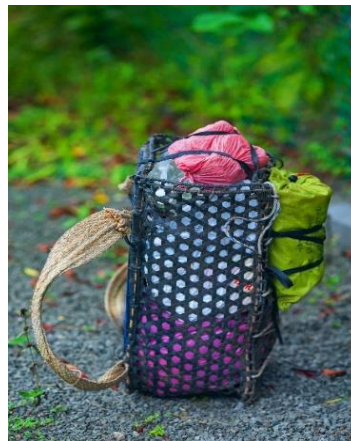
Rajah 2: Barait

Menurut Shamrie, beg ini dikenali sebagai barait yang merupakan beg galas tradisional Sabah diperbuat daripada buluh dan rotan. Buluh dipotong nipis dan halus dan seterusnya dianyam membentuk pelbagai bentuk dan rekaan. Saiz barait bergantung kepada saiz panjang rotan dan jumlah rotan yang dihiris. Proses pembuatan barait mengambil masa lebih kurang tiga hari hingga seminggu. Proses pembuatannya sukar. Justeru, hanya individu yang mahir mampu membuatnya. Barait ini sangat kukuh dan boleh digunakan untuk jangka masa yang lama. Ia digunakan bagi pelbagai tujuan terutamanya untuk membawa barang-barang ke kebun. (Travelog Pendakian Gunung Tambuyukon, 2022, hlm. 36)