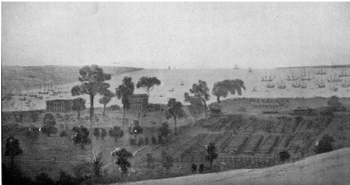
Gambar 1: Pondok asal banduan di Penjara Singapura

Pada tahun 1825, Penjara di Singapura pula dibuka. Penjara baru ini menempatkan semua banduan yang didapati bersalah dan mereka dikerahkan melakukan kerja memecah batu di luar penjara dan membina jambatan. Pada 18 April 1825, 80 banduan meliputi 79 lelaki dan seorang banduan wanita India dari Bangkahulu ditempatkan ke Singapura. Hanya beberapa hari selepas itu, jumlah kemasukan banduan terus bertambah. Pada 25 April 1825, 122 lagi banduan India dari Bangkahulu dihantar ke Singapura merangkumi 121 lelaki dan seorang wanita (Macnair, 1989). Pada tahun 1825 menjadi permulaan projek-projek besar kerajaan membina penjara di NNS. Peruntukan secara besar-besaran telah diturunkan kepada institusi penjara oleh kerajaan kolonial. Gambar 1 merupakan perkembangan binaan penjara di Negeri-Negeri Selat iaitu di Singapura yang berasal daripada pondok-pondok banduan.