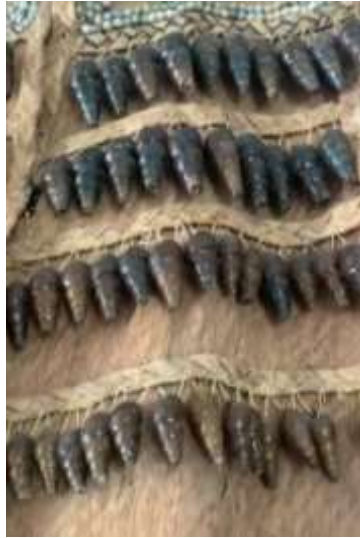
Rakah 4: Busana pemain muzik daripada kulit kayu, hiasa daripada siput air tawar dan biji rumput Dalai