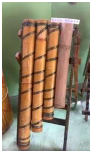
Rajah 3: instrumen muzik bambu ciptaan komuniti