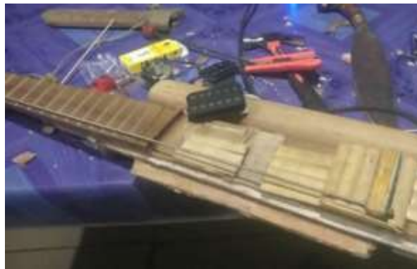
Rajah 2: Membuat instrumen muzik berasaskan bamboo di TABIK

Dari segi pembangunan pembangunan fizikal, terdapat fungsi TABIK yang utama iaitu menyumbang kepada pengukuhan dan kelangsungan warisan budaya dan alam sekitar dan menjadi tunjang pembangunan komuniti yang lestari. Oleh kerana TABIK sendiri merupakan ruang untuk menjalankan aktiviti termasuk aktiviti mendokumentasi, ruang latihan dan membuat alat muzik (Rajah 2 & Rajah 3) dan kraftangan tradisional, malah menyediakan taman botani yang menyimpan maklumat spesies yang mempuntai nilai dalam kehidupan masyarakat setempat, maka ia sekaligus menjadi satu mercu tanda kepada kesungguhan komuniti dalam memulihara warisan budaya dan alam sekitar. Ini juga membolehkan penglibatan komuniti dirancang secara lebih sistematik dan konsisten. Di samping itu, pemuliharaan warisan budaya muzik bambu secara langsung memulihara sumber alam semulajadi yang menjadi sokongan kepada tradisi ini termasuk busana pemain muzik yang dibuat daripada bahan semulajadi seperti kulit kayu dan biji datipada tumbuhan serta hidupan akuatik (Rajah 4).