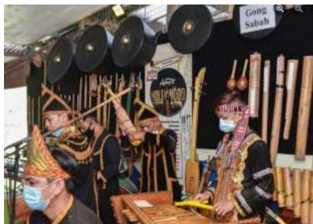
Rajah 5: Membuat persembahan menyambut pengunjung di TABIK

TABIK berfungsi sebagai sebuah institusi komuniti yang dikendalikan oleh persatuan berdaftar Suara Buluh Perinu. Ia mencipta peluang pekerjaan kepada dan sumber pendapatan kepada komuniti. Oleh itu TABIK menjadi ruang dalam pemerksaan modal insan melalui penglibatan komuniti yang memegang peranan dalam organisasi tersebut. Selain mencipta peluang pekerjaan, TABIK turut menjadi pembangunan ekonomi dengan mencipta peluang perniagaan kepada komuniti. Antaranya ialah perniagaan instrumen muzik bambu, kraf tangan berasaskan bambu dan pelbagai peluang perniagaan yang lain termasuk menjana pendapatan melalui persembahan yang dilakukan kepada pengunjung.