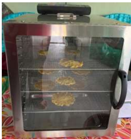
Rajah 2: Mesin Pengering

Penglibatan wanita dalam pasaran serunding kubis adalah satu cara yang dapat meningkatkan kuasa beli isi rumah. Maksudnya dengan melibatkan diri dalam pemprosesan dan pemasaran serunding kubis, untung yang diperolehi mampu memenuhi keperluan harian keluarga dan meningkatkan keupayaan pengusaha membeli peralatan seperti mesin pengering yang lebih besar dan membina dapur yang lebih luas. Malahan skala pengeluaran produk serunding kubis juga dapat diperbesarkan daripada 5 Kg kepada 20 Kg dan lebih dengan perkembangan modal dalam sekali proses.