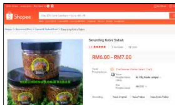
Rajah 3: Produk Serunding Kubis dalam Facebook dan Shopee