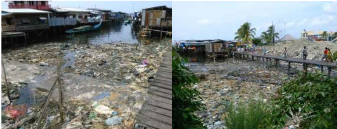
Foto 15 : Sisa Pepejal dan Sampah-Sarap di Pinggir Pantai Kampung Air, Semporna

pendapatan penduduk. Kajian di Negeri Sembilan mendapati kira-kira 60% responden menjual barangan kitar semula seperti besi, tin aluminium, kertas, bahan plastik dan botol kaca kepada peniaga atau pengusaha kitar semula (Sakawi et al., 2017).