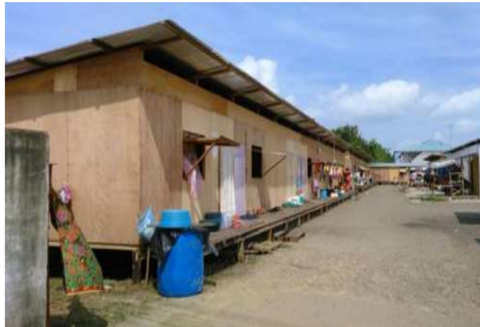
Foto 10: Bantuan Petempatan Sementara kepada Mangsa Kebakaran di Kampung Bangau-Bangau