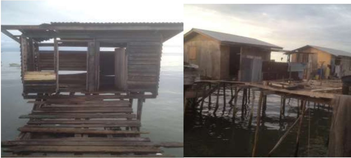
Foto 5: Rupa bentuk rumah dan tandas penduduk di Kampung Tanjung Kapor, Kudat