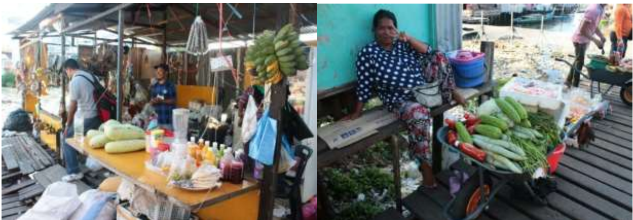
Foto 6: Aktiviti Perniagaan Kecil-Kecilan (Sektor Informal) di Kampung Air, Semporna Sumber : Penyelidik (2018).

Penduduk di kampung air terdiri daripada mereka yang memiliki kewarganegaraan Malaysia, status penduduk tetap dan ramai juga yang tiada dokumen yang sah termasuk pendatang tanpa izin yang sudah lama menetap di petempatan ini. Terdapat dalam kalangan mereka yang hanya berpendidikan sekolah menengah, sekolah rendah dan ada yang tidak mendapat pendidikan formal di samping yang dahulunya berhijrah dari kepulauan di selatan Filipina dan seterusnya menetap dengan saudara mara di kampung ini. Justeru, dengan ketiadaan pendidikan yang formal dan setakat belajar di sekolah rendah dan menengah sahaja, maka sumber pekerjaan penduduknya terbatas kepada konsep bekerja sendiri sahaja seperti nelayan dan berniaga dalam sektor informal termasuk sebagai pemandu teksi, kereta sapu, pembantu kedai dan restoran, mengusahakan kedai jahit dan gunting rambut secara kecil-kecilan, bekerja di pasaraya dan sektor pembinaan. Tahap pendidikan rendah sering dikaitkan dengan masyarakat di kawasan luar bandar. Ini kerana mereka menghadapi kekangan dalam aspek mendapatkan ilmu pendidikan, peluang pekerjaan dan memperoleh pendapatan tinggi (Siti Masayu Rosliah & Narimah, 2018).