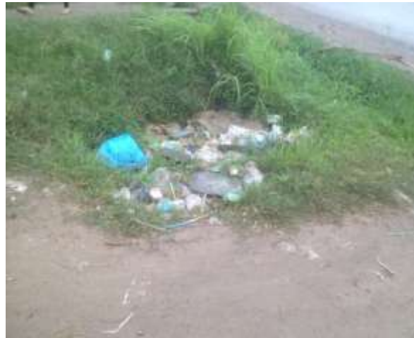
Foto 17 : Longgokan Sampah-Sarap di Kawasan Darat di Kampung Tanjung Kapor, Kudat Sumber: Penyelidik (2019).