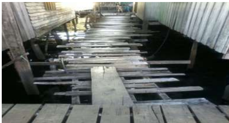
Foto 9: Titi yang Usang di Petempatan Kampung Simunul

Berbeza dengan petempatan kampung air di Kampung Simunul, kemudahan asas didapati kurang diambil berat sehinggakan ada jambatan dan titi yang menghubungkan antara rumah dan ke kawasan darat telah usang dan rosak (Foto 9).