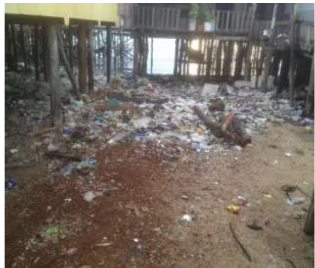
Foto 14 : Longgokan Sampah Sarap di Pinggir Pantai Kampung Tanjung Kapor, Kudat Sumber : Penyelidik (2019).

Sisa ini akan dihanyutkan dibawa arus dan pasang surut. Seterusnya, sisa pepejal dan kumbahan ini dihanyutkan ke pantai termasuklah ke pantai di kawasan tiga kampung air yang dikaji. Sisa tersebut terkumpul dan tersekat di situ, berbau busuk dan mencemarkan pandangan terutamanya pelancong dan pelawat yang datang ke pekan Semporna (Foto 15). Apatah lagi, kampung air terutamanya adalah petempatan atas laut yang terletak betul-betul dalam kawasan pekan ini. Inisiatif yang boleh diambil adalah dengan melakukan kitar semula. Ini merupakan satu tindakan yang baik bukan sahaja untuk menjaga persekitaran bahkan menjana pendapatan penduduk setempat. Jika dilihat banyak botol-botol plastik yang terdapat di kawasan kajian yang boleh dikitar semula dan dijual oleh penduduk yang boleh menjadi salah satu sumber