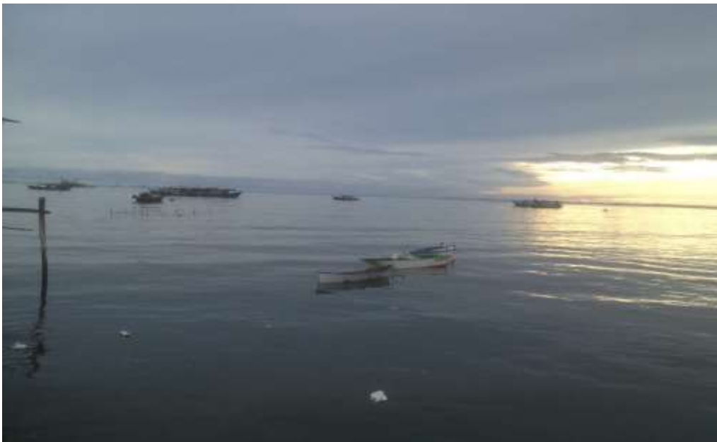
Foto 7 : Bot untuk Aktiviti Nelayan di Kampung Tanjung Kapor

Foto 6 menunjukkan antara contoh aktiviti sektor informal yang diusahakan oleh penduduk di Kampung Air. Sehubungan itu, terdapat sesetengah ibu bapa yang berpendapatan kecil serta tidak mampu menyara persekolahan anak-anak di samping ada masalah kerakyatan. Implikasinya, ibu bapa hanya mewariskan pekerjaan mereka kepada anak-anak untuk terus bekerja sebagai nelayan dan terlibat dalam aktiviti sektor informal. Pendidikan ibu bapa yang rendah cenderung menyebabkan pencapaian pendidikan turut rendah dalam kalangan anak mereka. Kemiskinan menyebabkan persekitaran yang tidak menggalakkan pembelajaran, seperti suasana bising serta terpaksa membantu ibu bapa (Siti Masayu Rosliah & Narimah, 2018).