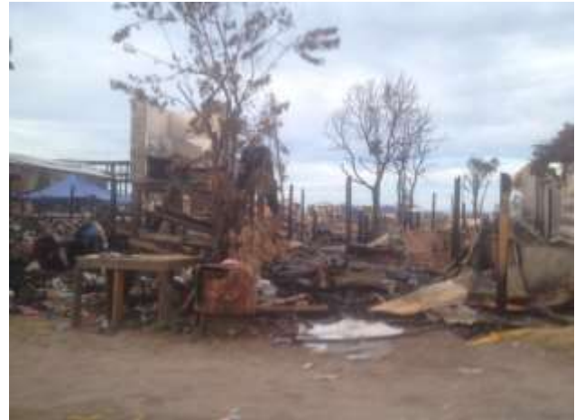
Foto 13 : Petempatan yang terlibat dengan Kebakaran di Kampung Tanjung Kapor

Foto 13 menunjukkan petempatan kampung Tanjung Kapor juga mengalami masalah kebakaran. Pada tahun 2016, kebakaran berlaku di Kampung Tanjung Kapor yang memusnahkan banyak rumah di kawasan pinggir pantai.