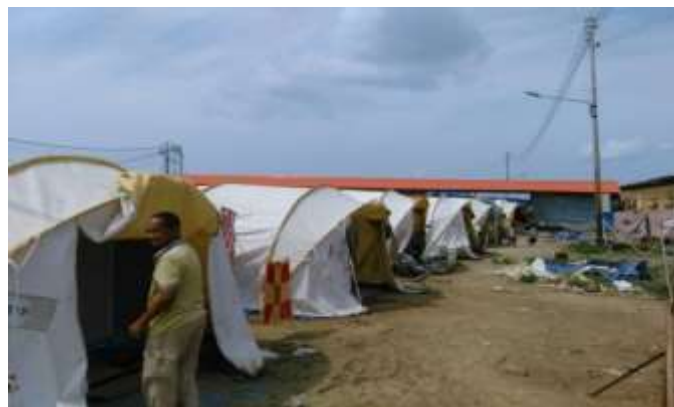
Foto 12 : Petempatan Sementara Mangsa Kebakaran di Kampung Bangau-Bangau Sumber : Ihsan Penduduk (2017).