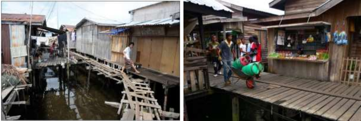
Foto 2: Kampung Bangau-Bangau, Semporna Sumber : Penyelidik (2018).

Kampung Simunul terletak kurang satu kilometer dari pekan Semporna dan berhampiran dengan hutan paya bakau. Majoriti penduduknya adalah daripada suku kaum Suluk dan Bajau. Seperti di Kampung Bangau-Bangau, kedudukan rumah di atas laut di kampung ini adalah berselerak, dibina rapat dan ada yang dihubungkan antara rumah dengan titian kecil sahaja. Antara kemudahan yang terdapat di kampung ini ialah bekalan elektrik dan air, kemudahan jalan raya di bahagian darat kampung, masjid dan sekolah rendah dan balai polis marin. Berdasarkan temu bual dengan salah seorang penduduk kampung, terdapat pendatang tanpa asing (PATI) yang tinggal di petempatan ini.