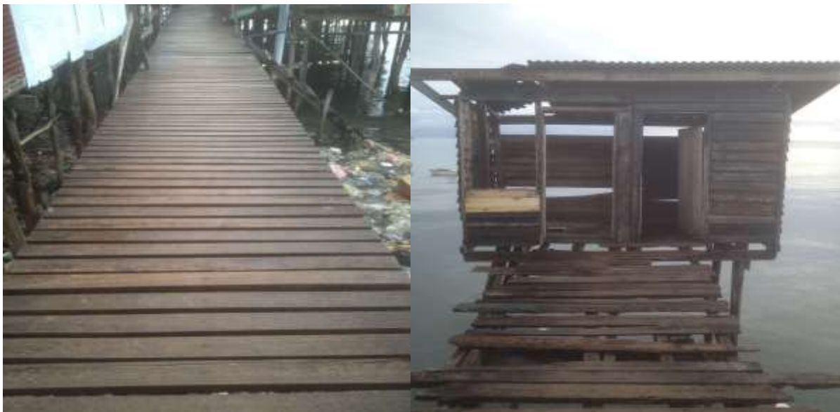
Foto 11: Keadaan Titian yang baik dan Tandas Awam yang usang di Kampung Tanjung Kapor