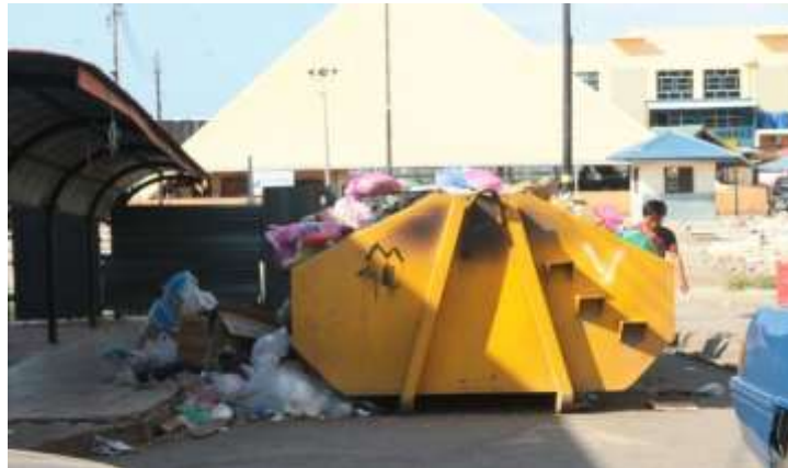
Foto 16 : Longgokan Sampah-Sarap di Kawasan Darat di Sekitar Kampung Air