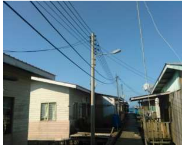
Foto 8 : Bantuan Pembaikan Kemudahan Jambatan dan Bekalan Elektrik di Kampung Air Sumber : Ihsan Penduduk (2017).

Berbeza dengan petempatan kampung air di Kampung Simunul, kemudahan asas didapati kurang diambil berat sehinggakan ada jambatan dan titi yang menghubungkan antara rumah dan ke kawasan darat telah usang dan rosak (Foto 9).