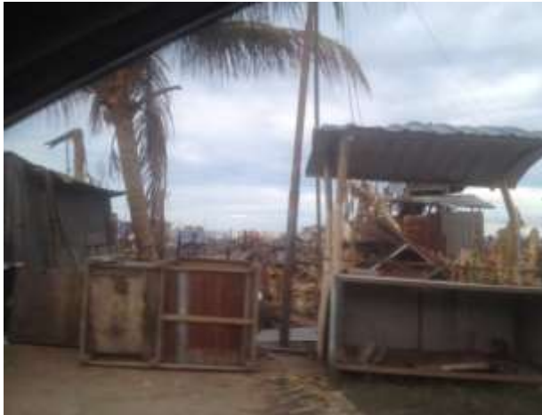
Foto 12 menunjukkan petempatan sementara yang disediakan kepada mangsa kebakaran di Kampung Bangau-Bangau. Pada tahun 2019, Kampung Air yang terletak berhampiran pekan Semporna turut mengalami kebakaran besar.