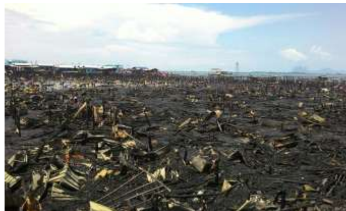
Foto 11 : Kebakaran di Kampung Bangau-Bangau Sumber : Ihsan Penduduk (2017).